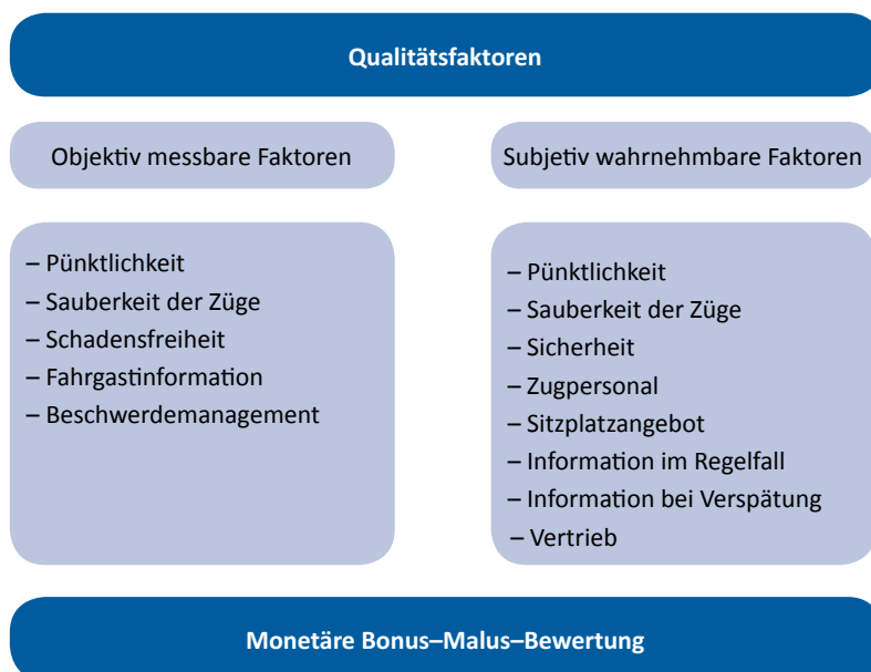
Abbildung 3: Qualitätsfaktoren

Die qualitativen und quantitativen Qualitätsfaktoren lauteten im Detail: