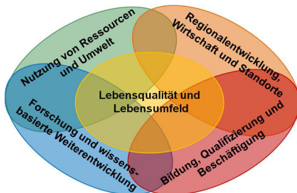
Abbildung 2: Entwicklungsstrategie Burgenland 2020 – Gesamtübersicht der Strategiefelder