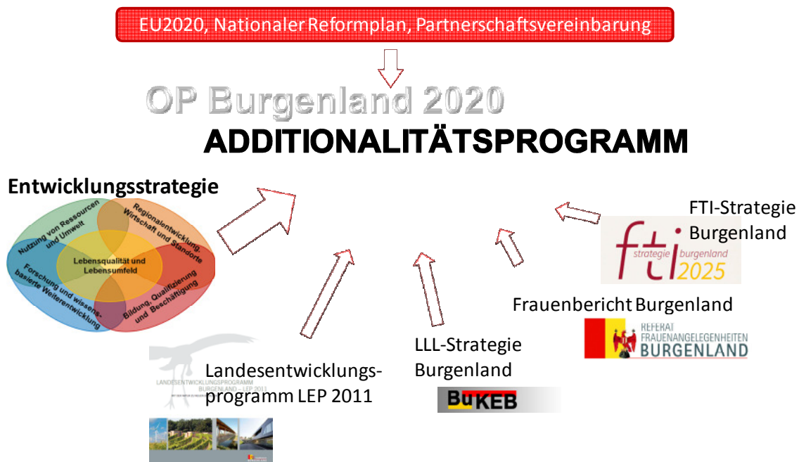
Abbildung 1: Einbettung des Additionalitätsprogramms Burgenland ESF

In das Additionalitätsprogramm Burgenland 2014-2020 ESF fließen Ziele aus unterschiedlichen Politikbereichen und Ebenen ein. Aufbauend auf der Hauptstrategie, der Europa 2020 Strategie, die auch den Hintergrund für die Detailfestlegungen der EFRE- und ESF-Verordnungen und Programme darstellt, werden im ergänzenden Additionalitätsprogramm ESF insbesondere Entwicklungsstrategien für die soziale und bildungsbezogene Weiterentwicklung des Burgenlandes berücksichtigt.