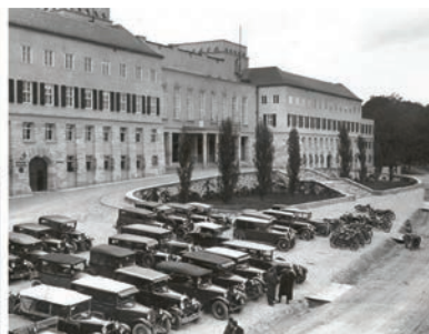
1932 Landesregierung Eisenstadt