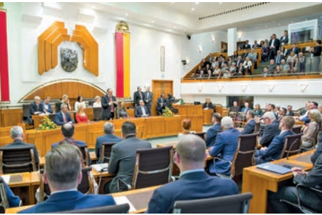
Mitglieder der Landesregierung während einer Landtagssitzung