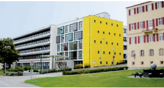
1973 Neubau Landhaus-Neu, 2009 Generalsanierung