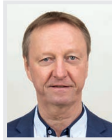
2. PRÄSIDENT DES BGLD. LANDTAGES Johann Tschürtz (FPÖ)