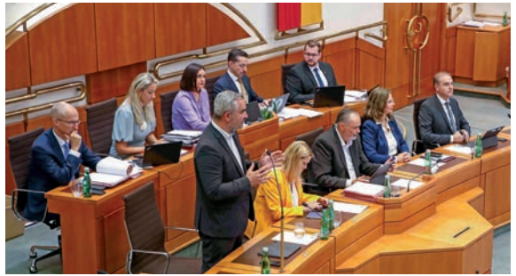
Mitglieder der Landesregierung und des Präsidiums während einer Landtagssitzung

wenn es von der Präsidentin oder von mindestens einem Sechstel der anwesenden Mitglieder des Landtages verlangt und die Entfernung der Zuhörer beschlossen wird.