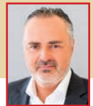
Mag. Hans Peter Doskozil LH-SPÖ