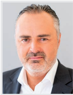
Landeshauptmann Mag. Hans Peter Doskozil

Das oberste Vollzugsorgan in Angelegenheiten der burgenländischen Landesverwaltung ist die Burgenländische Landesregierung. Sie wird vom Landtag gewählt und ist diesem rechtlich und politisch verantwortlich.