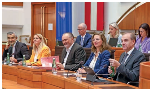
Sitzung des Bgld. Landtages, Landeshauptmann Mag. Hans Peter Doskoszil