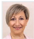
3. Präsidentin (SPÖ)