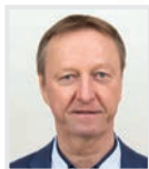
2. Präsident (FPÖ)