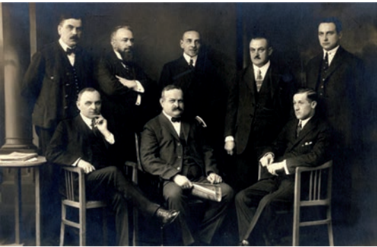
Burgenländische Landesregierung 1922

Ungarn versuchte mit allen politischen Mitteln diesen Verlust zu verhindern und obwohl es nach zähem diplomatischen Ringen im Friedensvertrag von Trianon (4. Juni 1920) die Abtretung des Landes zur Kenntnis nehmen musste, verstärkte es weiter seinen Kampf, der Ende August 1921 in blutigen Freischärlerkämpfen mündete. Österreich musste nach Verlusten an Menschenleben – entsprechend den Vereinbarungen von Trianon – seine ins Land einmarschierenden Gendarmeriekräfte und Beamten zurückziehen. In dieser schwierigen Situation schaltete sich Italien als Vermittler ein und brachte Österreich und Ungarn in Venedig an den Verhandlungstisch. Im „Venediger Protokoll“ vom 13. Oktober 1921 verpflichtete sich Ungarn, das Burgenland endgültig an Österreich abzutreten.