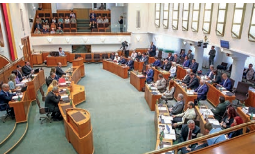
Landtagsabgeordnete während einer Sitzung