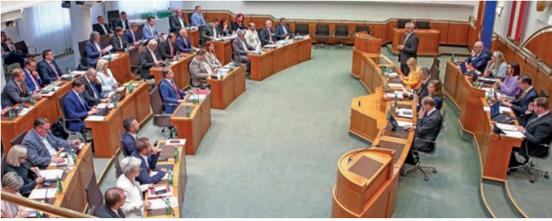
Landtagsabgeordnete während einer Landtagssitzung